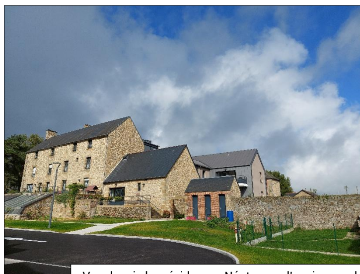
Vue depuis les résidences Néotoa sur l'ancien presbytère

Financements : Commune de Louvigné-du-Désert, Fougères Agglomération, Conseil Départemental d'Ille-et-Vilaine, Caisse des Dépôts, État, Néotoa.