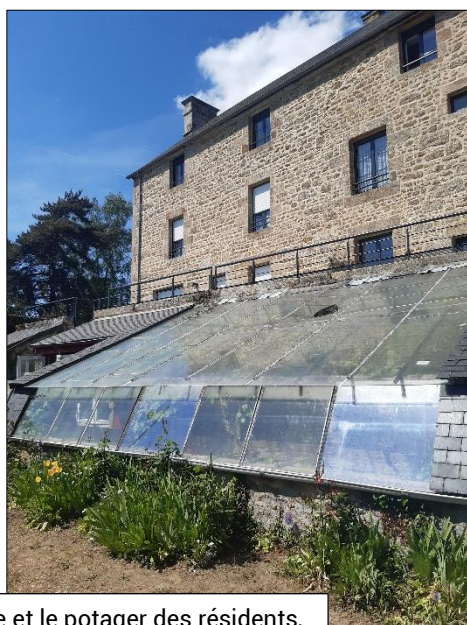
La serre et le potager des résidents, tout proche du presbytère